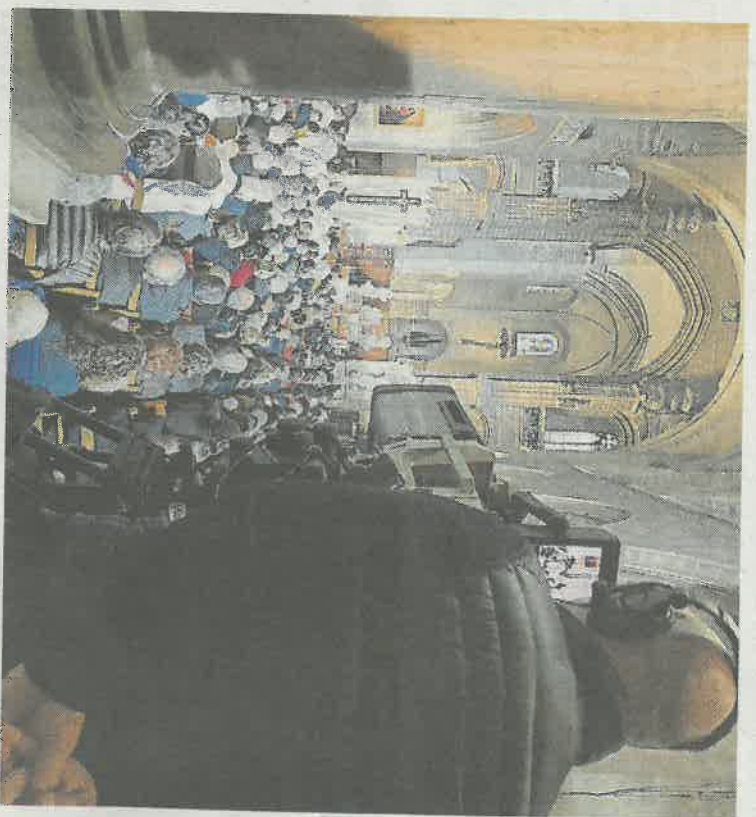
Pour respecter le format de l'émission, la durée de la messe a été raccourcie d'une vingtaine de minutes.