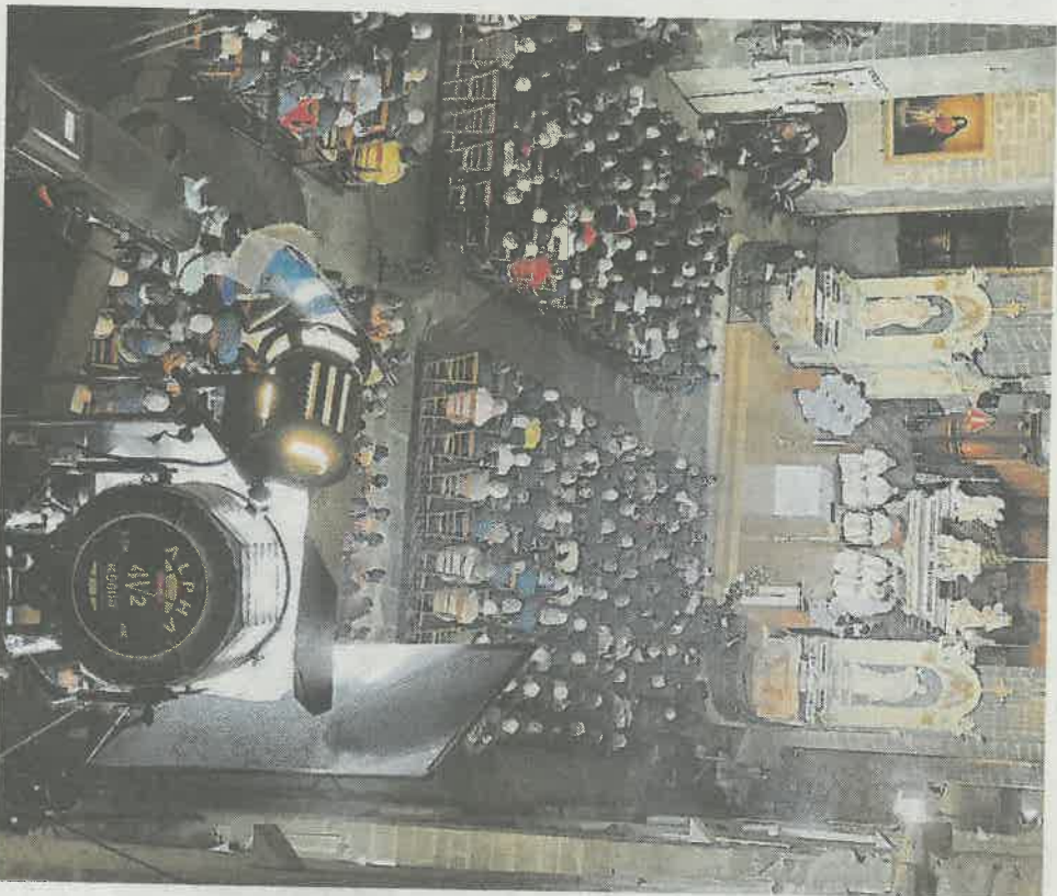
La messe consacrée à Saint-Vincent-Farrier, ce dimanche, était retransmise dans l'émission « Le Jour du Seigneur » sur France 2.