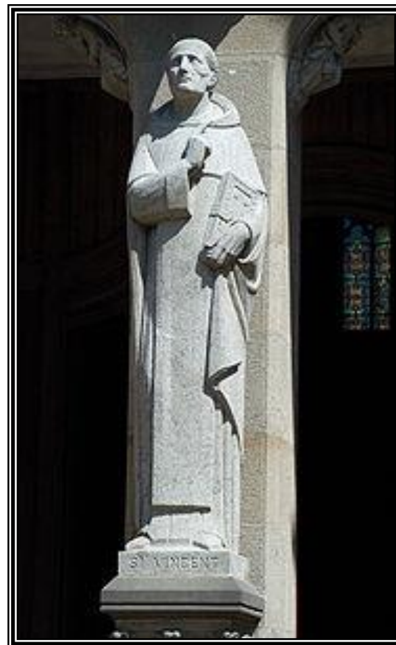
Saint Vincent Ferrier Trumeau de la Cathédrale de Vannes